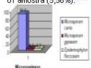
Gráfico 1 - Percentagem de microrganismos isolados em cães e gatos.

Os resultados em pêlos de gatos revelaram Microsporum canis em 20 amostras (58,82%) e Microsporum gypseum em 01 amostra (2,94%). Já em cães, Microsporum canis foi encontrado em 02 amostras (11,11%) e Epidermophyton floccosum em 01 amostra (5,56%).